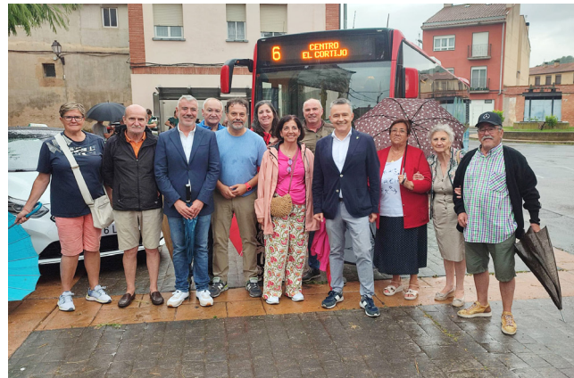
El alcalde presentó los nuevos servicios en el Barrio.

Asimismo, se ha acordado con los taxistas de Logroño el establecimiento de un precio pactado para los servicios que se demanden entre la ciudad y el barrio. Será de 16 euros si el servicio se solicita entre semana y de 19 euros si se contrata en domingos y festivos o si el servicio es nocturno.