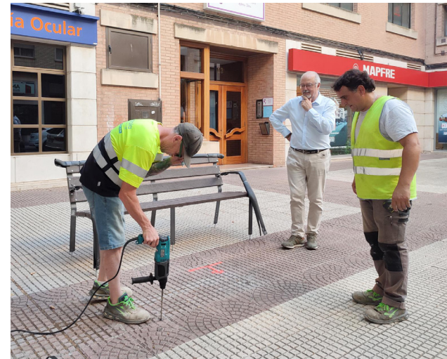
■ Dos de los nuevos bancos se instalaron en la calle Belchite.

Los bancos generados con materiales reciclados ofrecen beneficios significativos en términos de sostenibilidad ambiental, reducción de residuos, conservación de recursos naturales, economía circular, durabilidad y conciencia ambiental. En resumen, una opción responsable que contribuye a un entorno urbano más saludable y ecológico. La instalación de estos bancos forma parte del proyecto ‘Logroño, destino de compras’, que cuenta con financiación europea a través de los fondos Next Generation EU. Ha sido realizada por la empresa Parques y Jardines Fábricas, S.A. tras la adjudicación, el pasado 5 de junio por parte de la Junta de Gobierno Local, del contrato para el suministro de 148 bancos y la instalación de las 80 unidades por una cuantía de 60.500 euros (IVA incluido).