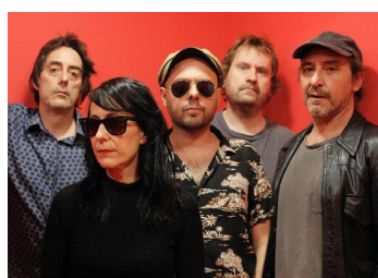
El columpio asesino

Tres superfiguras de la talla de los navarros El Columpio Asesino , que se despiden de la música, el reconocido músico pop Xoel López y los rockeros progresivos andaluces Derby Motoreta's Burrito Kachimba prometen una jornada ecléctica y de calidad.