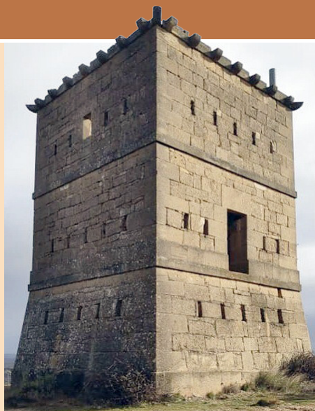
El Castillete

Esta torre, de la década de los 30 del siglo XIX, es un elemento de un sistema de telegrafo óptico. La telegrafía óptica, que se basa en el establecimiento de puntos altos visualmente conectados que permiten, con un código previamente establecido y conocido, enviar mensajes visuales de un punto a otro, tiene sus orígenes formales en el siglo XVIII. En realidad, la comunicación por sonidos o señales es antiquísima; pensemos en las tradicionales ahumadas, la señal que se hacía en las atalayas para dar algún aviso, quemando paja u otro material. En España, los primeros intentos de establecer un telégrafo óptico se produjeron en Cádiz y, más tarde, uniendo Madrid con los Sitios reales de Aranjuez y San Ildefonso. Un tercer intento, previo al establecimiento de un sistema radial desde Madrid en 1844 por Mathé, tuvo como epicentro Logroño y aconteció en el marco de la Primera guerra carlista (1833-1840). Estando el hermano