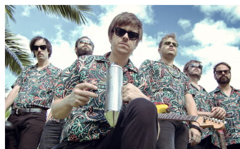
Los Mejillones Tigre