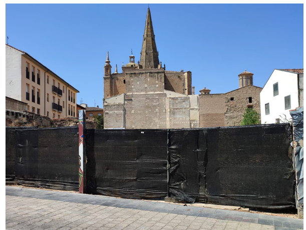
■ Solar de la calle Marqués de San Nicolás en el que se ubicará el centro de nuevas tecnologías.

La empresa, en el plazo de cinco días a partir de la firma del convenio, desistirá de la solicitud de licencia conjunta de obras y ambiental y del proyecto básico presentado para la construcción de edificio de oficinas y residencia en el número 20 de la calle Marqués de San Nicolás e iniciará el procedimiento administrativo del nuevo proyecto según los aspectos recogidos en el convenio urbanístico de planeamiento suscrito entre ambas partes.