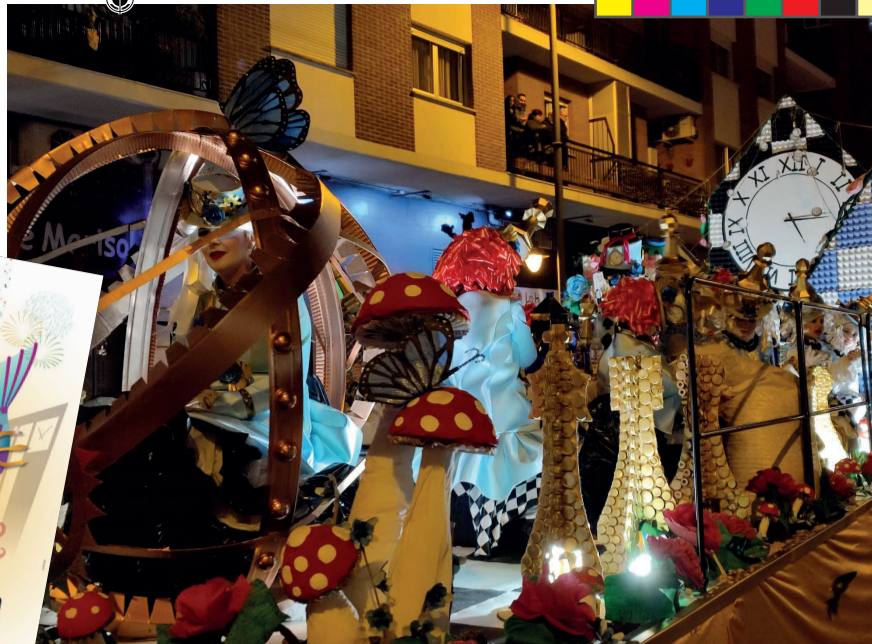
Carroza ganadora del AMPA de Salesianos Domingo Savio.