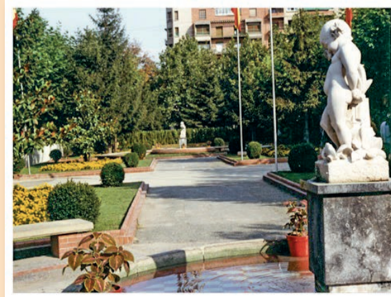
■ La Glorieta en 1972 (López Osés)