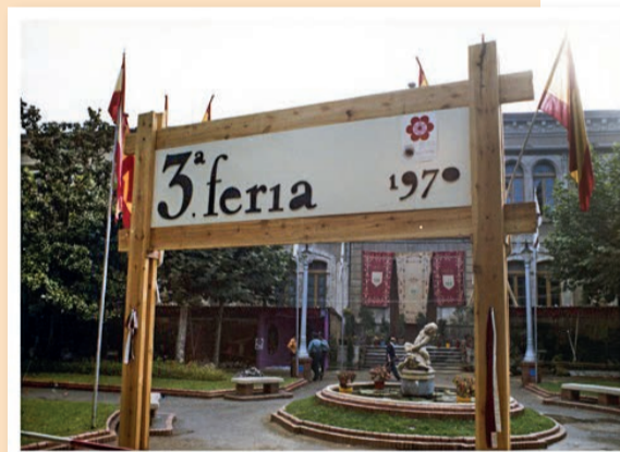
■ III Feria de la Flor y la Planta, 1970 (Foto Teo).