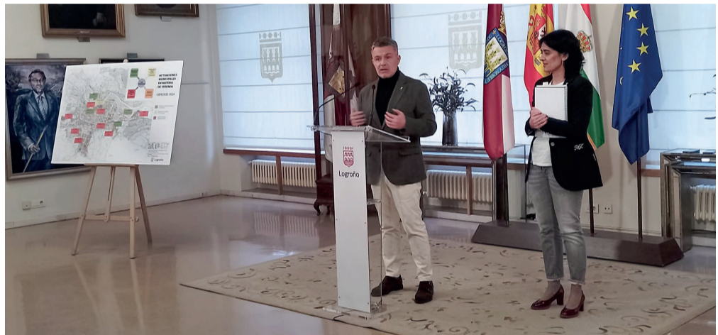
El alcalde destacó en la presentación que el plan comprende a toda la ciudad.

El alcalde resaltó que “todas estas actuaciones forman parte, por tanto, de un ambicioso proyecto de vivienda de naturaleza transversal que englobará el trabajo de diferentes unidades municipales y tendrá un marcado carácter integral, con actuaciones en la práctica totalidad de los distritos de la ciudad y