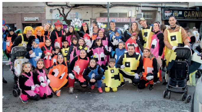
Excepcional animación, la participación de todo Logroño y una imaginación portentosa en el carnaval 2024.