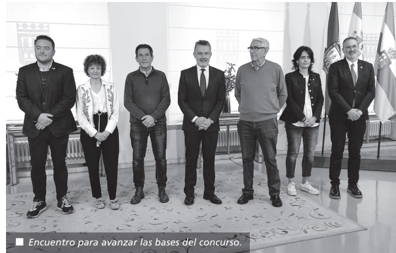
■ Encuentro para avanzar las bases del concurso.

La previsión del Ejecutivo municipal para desarrollar este importante proyecto, que cuenta con una subvención de 2,6 millones de euros de fondos europeos y en el que se prima la participación de diferentes colectivos de la ciudad afectados, es que la obra comience a inicios de 2025 y finalice en torno a marzo de 2026.