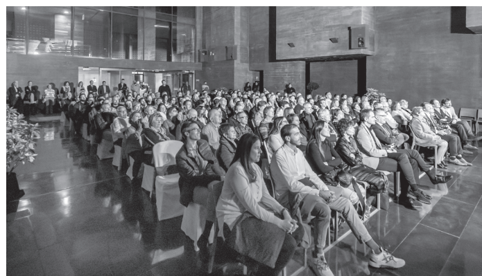
■ 150 vecinos pudieron disfrutar de un espectáculo de magia en el acto oficial de reapertura del CCR.