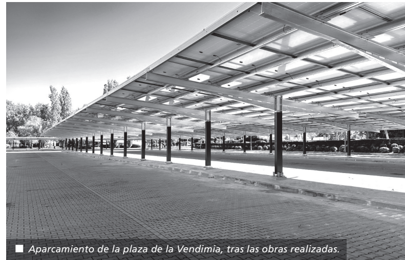
■ Aparcamiento de la plaza de la Vendimia, tras las obras realizadas.

Las 260 plazas de aparcamiento existentes en este punto de la ciudad se mantienen, pasando así a estar bajo cubierta.