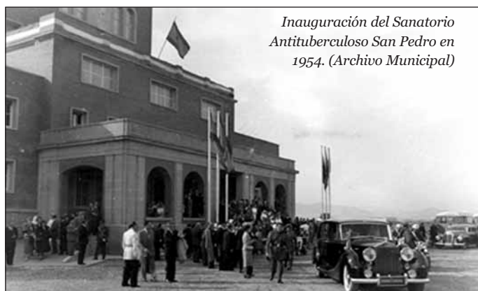
Inauguración del Sanatorio Antituberculoso San Pedro en 1954.

Dos hechos primordiales cambiaron y transformaron la zona: en primer lugar, la edificación del Sanatorio