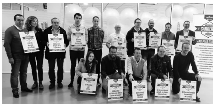
Presentación del VII Circuito de Carreras de Logroño.