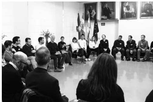
El foro ha contado con más de 30 participantes.

La Sala de Retratos acogió el día 30 el primer encuentro entre jóvenes talentos que trabajan fuera de Logroño y la Corporación del Ayuntamiento.