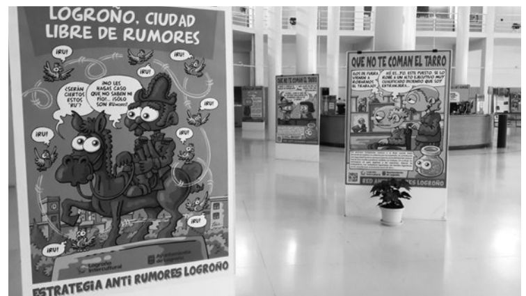
Paneles de la exposición 'Anti Rumores'.

Esta muestra expone el trabajo de la estrategia Anti Rumores de Logroño, una iniciativa municipal que promueve, a través de la formación y la divulgación, la identificación de los elementos que distorsionan la comprensión de la diversidad y dificultan el entendimiento y