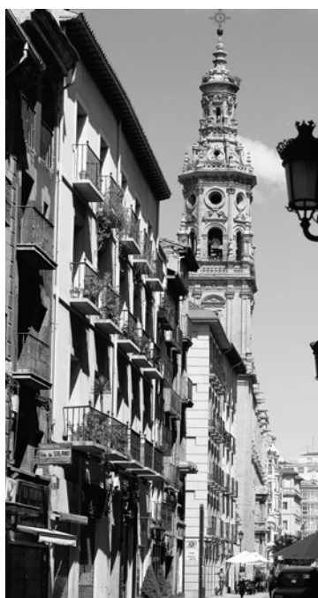
Edificios de la calle Portales.

El Ayuntamiento de Logroño, a través de la Concejalía de Patrimonio y Centro Histórico, destinará 1.200.000 euros en ayudas dirigidas a la rehabilitación de edificios del centro histórico y de interés histórico-artístico, para las que se han recibido 45 solicitudes en el año 2019; y 350.000 euros para las obras que facilitan la accesibilidad universal, con 98 solicitudes registradas.