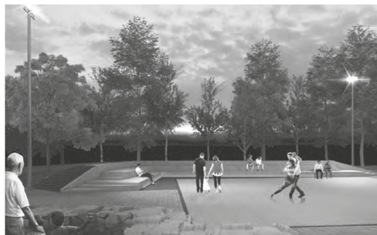
Imágenes del proyecto del nuevo espacio polivalente.