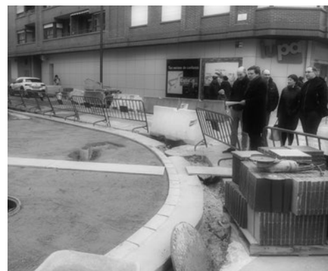
Visita a las obras de la calle Múgica.

Estas mejoras de accesibilidad suponen, en palabras de Kilian Cruz Dunne, concejal de Participación Ciudadana del Ayuntamiento de Logroño, "una importante mejora para la zona, no solo estética, sino de calidad urbana y permiten dotar a la calle de nuevas redes de recogida de aguas pluviales, alumbrado público y red de abastecimiento, y aquellas infraestructuras pendientes de renovación, como acometidas de gas".