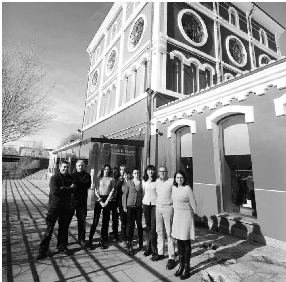
Equipo de la Casa de las Ciencias.

Por esta casa tan singular han pasado (y pasarán) reconocidos científicos, otros no tanto