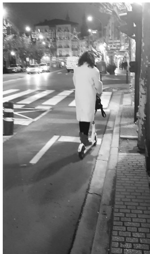
Una mujer con monopatín eléctrico por un carril bici.

La Dirección General de Tráfico ha publicado una instrucción transitoria vigente desde el 4 de diciembre en la que establece una serie de criterios dirigidos a los usuarios de VMP; entre ellos, deja muy clara su prohibición para que circulen por las aceras y fija a criterio de los Ayuntamientos la regulación de por dónde pueden circular. Por ese motivo, el Consistorio ha puesto en marcha la Ordenanza de VMP.