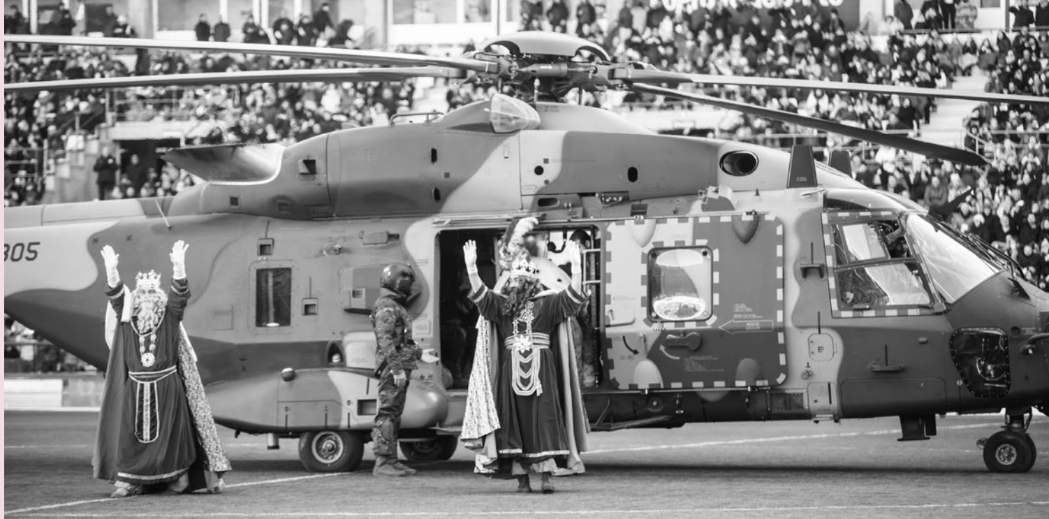
Diferentes momentos de la llegada de los Reyes Magos y de la cabalgata.