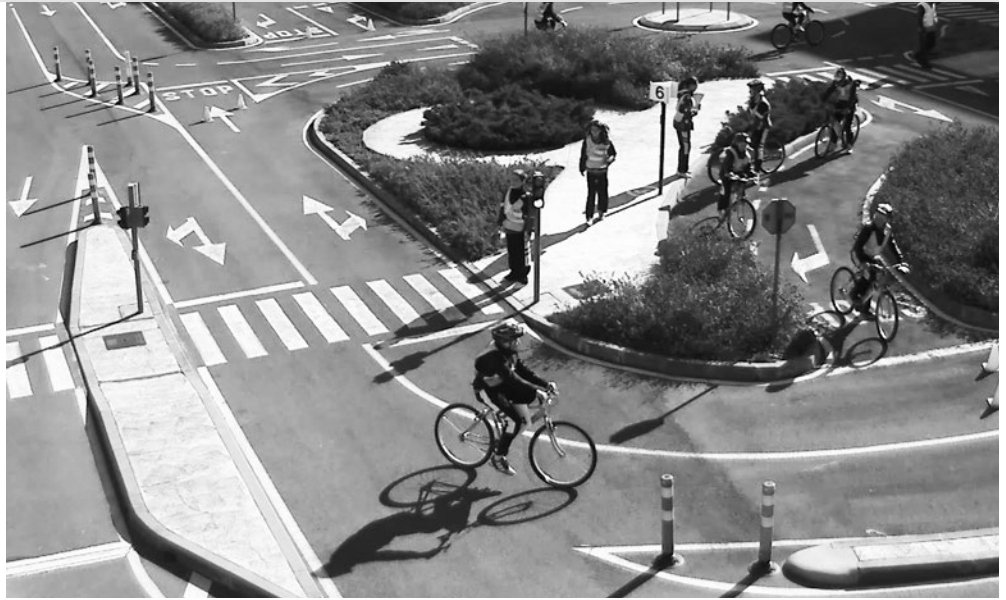
Estudiantes en el Parque Infantil de Tráfico.