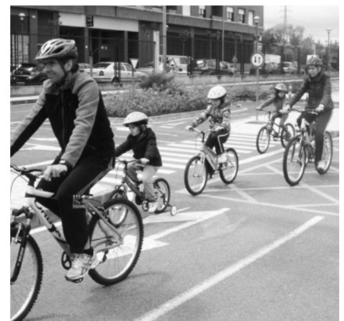
Adultos y menores en bicicleta.