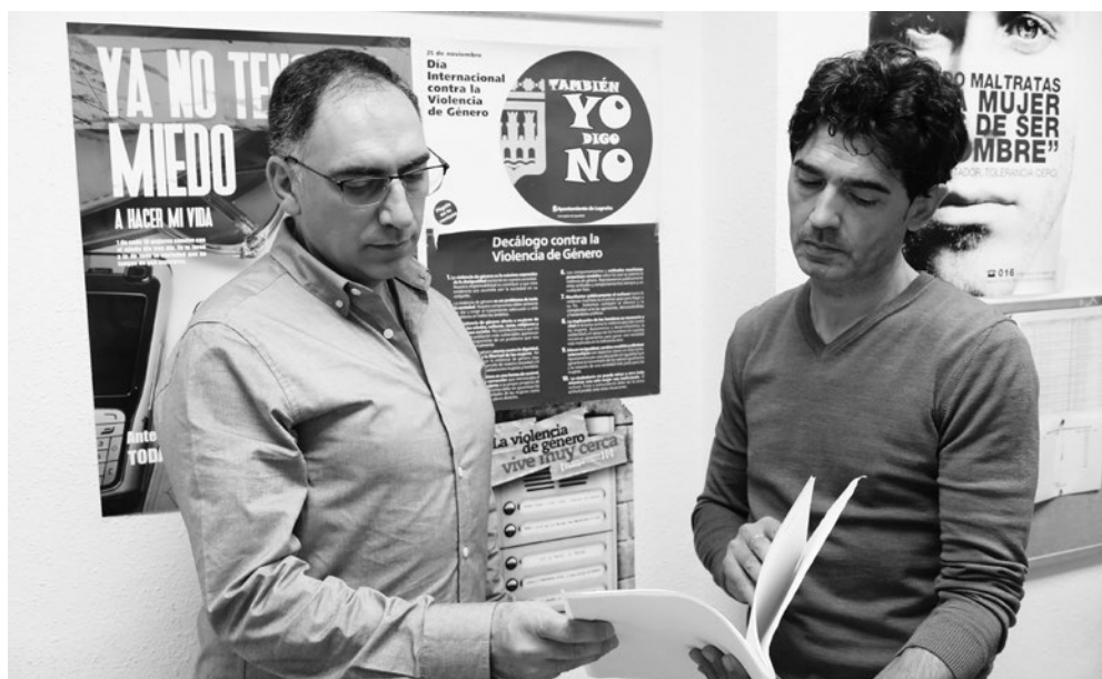
Personal del servicio.

En la actualidad, el Grupo de Convivencia e Intermediación de la Policía Local de Logroño trabaja con 75 casos de violencia de género; de ellos, 69 son de riesgo medios y 6, de riesgo alto.