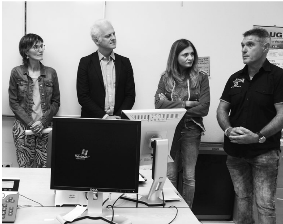
Responsables del servicio junto al alcalde de Logroño y a la concejala de Igualdad.

Entre las amplias funciones de esta unidad se encuentra también la de mantener un contacto permanente con las mujeres maltratadas y detectar y controlar las posibles situaciones de riesgo. Para ello, desarrolla información procedente de otros servicios policiales e instituciones públicas o privadas