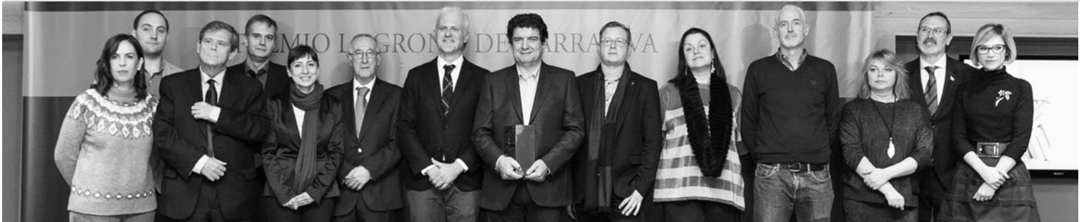
Los premiados, con el jurado y representantes del Ayuntamiento de Logroño.