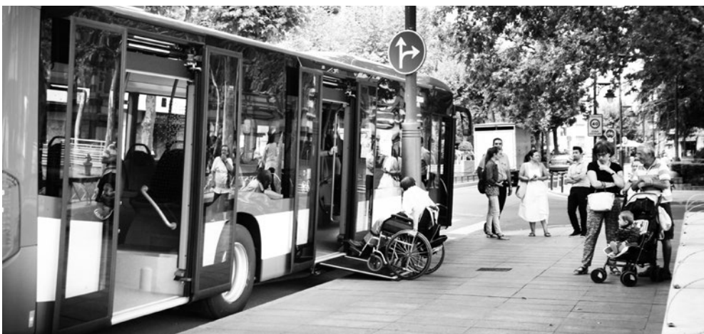
Un autobús del servicio urbano de transporte.

El actual reglamento de la DGT señala que, siempre entre la puesta y la salida del sol, se ha de llevar en la parte delantera una luz de posición de color blanco y en la parte trasera otra luz de posición de color rojo y un catadióptrico, no triangular, del mismo color. Opcionalmente, se pueden añadir catadióptricos de color amarillo en los radios de las ruedas o en los pedales.