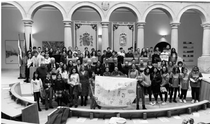
Participantes en el acto del Parlamento.