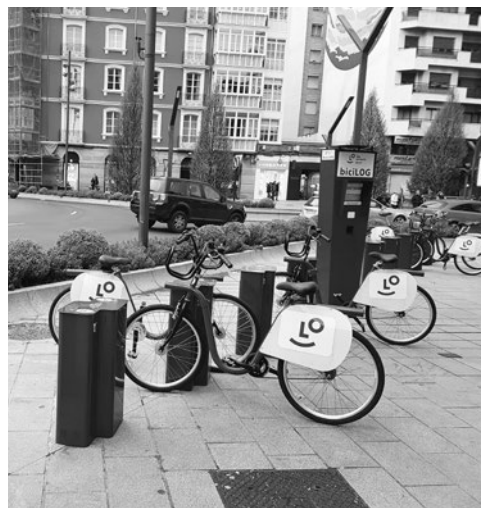
Servicio de bicicletas municipales.

También recuerda la necesidad de trabajar día a día para concienciar a la ciudadanía en la educación vial, en los accidentes que pueden surgir en la ciudad y, fundamentalmente, en los atropellos que en ella se producen. “El objetivo es que Logroño se convierta en una ciudad sin atropellos y sin accidentes de tráfico, y para ello es importante la concienciación y también que nuestra ciudad se convierta poco a poco en un lugar de ‘calles 30’, en un lugar en el que podamos usar el transporte público y otros transportes alternativos al vehículo”, afirma Caballero.