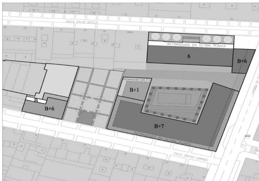
Parcela de Maristas 2018