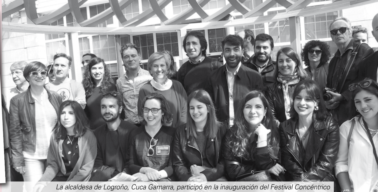
La alcaldesa de Logroño, Cuca Gamarra, participó en la inauguración del Festival Concéntrico