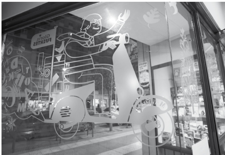
Ilustración en la librería Canseco

'Cien años de soledad'; mesas redondas; teatro o cursos de creación literaria.