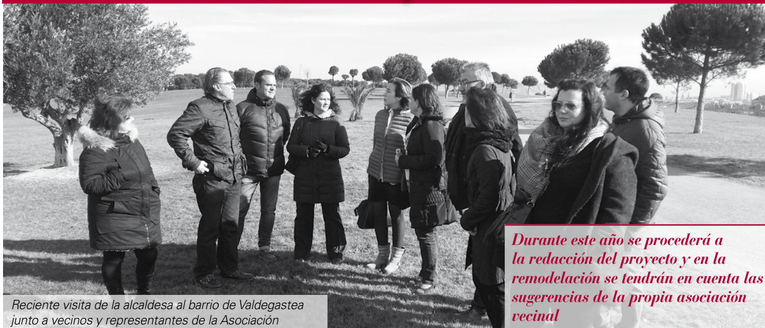
Reciente visita de la alcaldesa al barrio de Valdegastea junto a vecinos y representantes de la Asociación

Durante este año se procederá a la redacción del proyecto y en la remodelación se tendrán en cuenta las sugerencias de la propia asociación vecinal