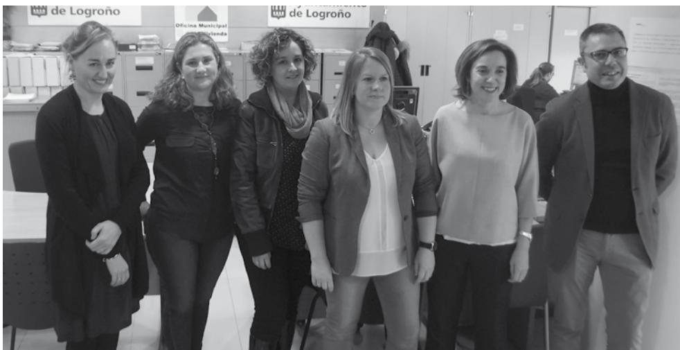
Visita de la alcaldesa al equipo económico-jurídico de la Oficina Municipal de Vivienda

La mayor parte de las consultas demandan asesoría jurídica relativa a comunidades de propietarios, compraventa o a la Ley de arrendamientos urbanos; dentro de las consultas económicas, las relacionadas con las hipotecas, gastos e impuestos y, la que ocupó principalmente la reunión de la alcaldesa, la revisión de las 'cláusulas suelo'.