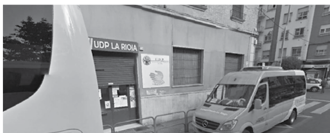
La UDP La Rioja gestionará la nueva sede que se ubica en los alrededores de la estación de autobuses

Este piso -con una superficie de 83,57 metros cuadrados en los que se habilitarán tres o cuatro habitaciones individuales, salón, cocina y baños- será gestionado por la asociación ARPA (Autismo-Rioja) para lo que contará con un trabajador social y un educador