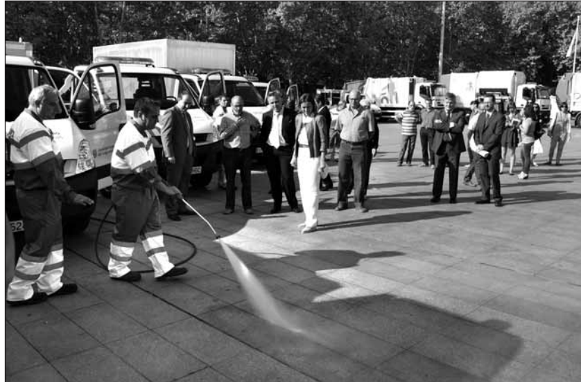
La alcaldesa de Logroño comprueba el funcionamiento de los nuevos vehículos de limpieza

Así, se incorpora un compactador de residuos en el Parque de Limpieza que optimizará los desplazamientos hasta la planta de tratamiento y se potenciarán los equipos de limpieza de los barrios periféricos. Para ello, se incorporarán