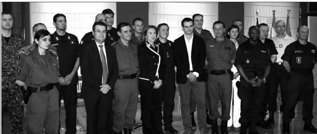
La alcaldesa y varios concejales recibieron en el Ayuntamiento de Logroño a los representantes de la Gendarmería Europea