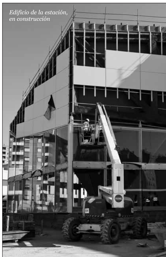
Edificio de la estación, en construcción