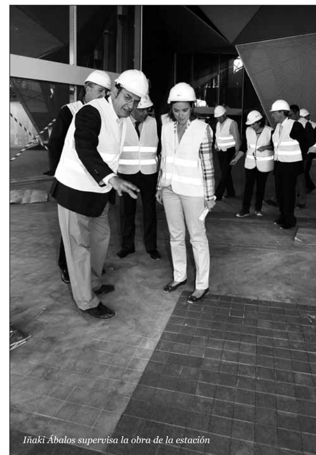
Iñaki Ábalos supervisa la obra de la estación

El conocido arquitecto se ha referido también a la "singularidad, poco habitual en estos trabajos de la creación de un parque público que debiera acabar teniendo continuidad y estableciendo un cinturón verde de Este a Oeste".