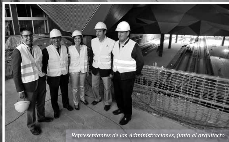
Representantes de las Administraciones, junto al arquitecto

Estado actual de la nueva estación de ferrocarril de Logroño, con las vías férreas ya colocadas, así como las escaleras de acceso. Destaca por su diseño y dimensiones la cubierta de esta zona de andenes.