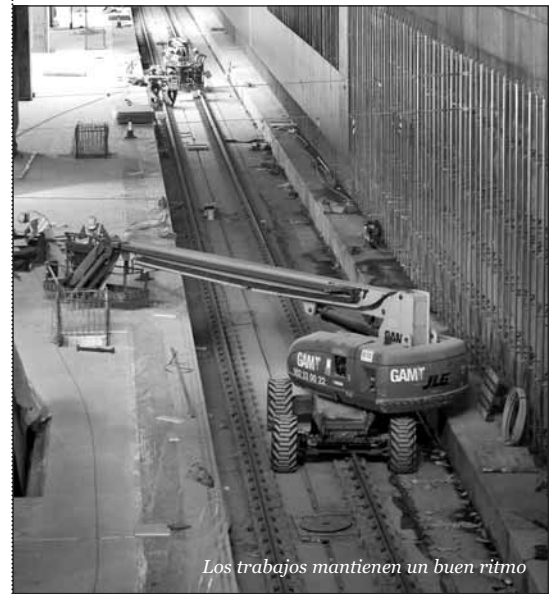
Los trabajos mantienen un buen ritmo

Durante la supervisión de las obras, se ha cifrado el avance de las mismas, con un 87% de las infraestructuras ejecutadas y un 67%