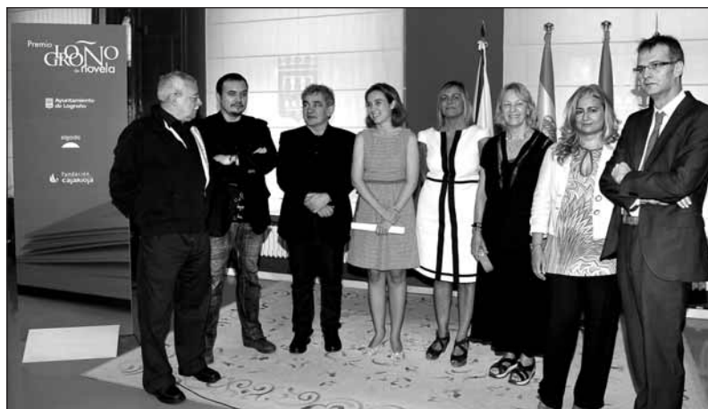
Reunión de los miembros del jurado con la alcaldesa de Logroño y entidades organizadoras

Entre otros galardones, ha obtenido el Premio Lengua de Trapo 2003,