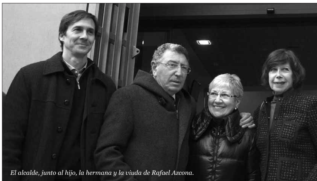
El alcalde, junto al hijo, la hermana y la viuda de Rafael Azcona.