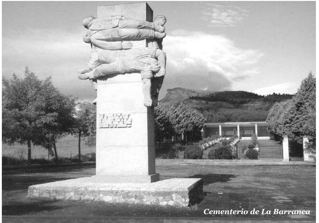
Cementerio de La Barranca