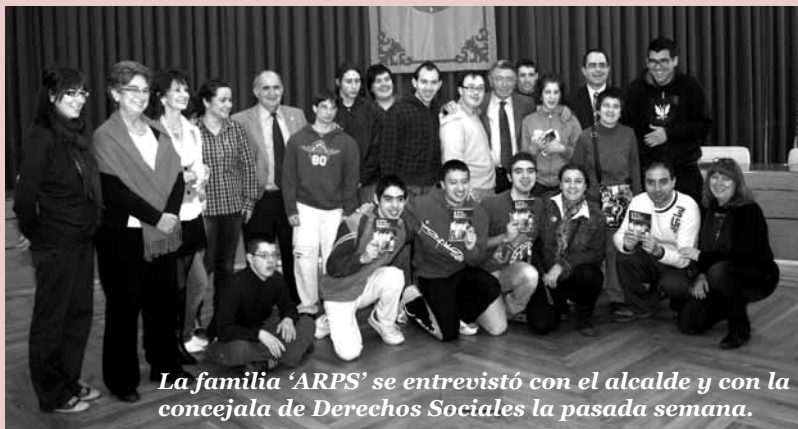
La familia 'ARPS' se entrevistó con el alcalde y con la concejala de Derechos Sociales la pasada semana.