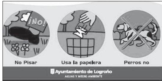
Paneles como éste ya pueden verse en los parques.

En total, se van a instalar 65 paneles de señalización en los distintos parques y plazas de Logroño. Además de señalar adecuadamente los usos permitidos y no permitidos en cada zona verde, la edil de Medio Ambiente anunció que se van a instalar vallados para delimitar las zonas de juegos infantiles y los 'areneros' de los parques de La Cometa, La Laguna, San Miguel, Joaquín Elizalde y Río La Calzada.