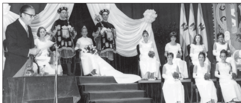
Escenario de los Juegos Florales de 1969.

Pero es más complicado encontrar ejemplos de estímulo de la creación literaria. En el ámbito poético, el mecenazgo (compartido) se materializó únicamente en unos reformulados Juegos Florales que tuvieron lugar en las fiestas de San Mateo y la Vendimia (en 1948, y desde 1955 a 1976) para la exaltación de los valores riojanos. Entre los autores premiados con la "Flor natural" (galardón otorgado) destaca Gerardo Diego en 1967 con unos versos que comienzan: