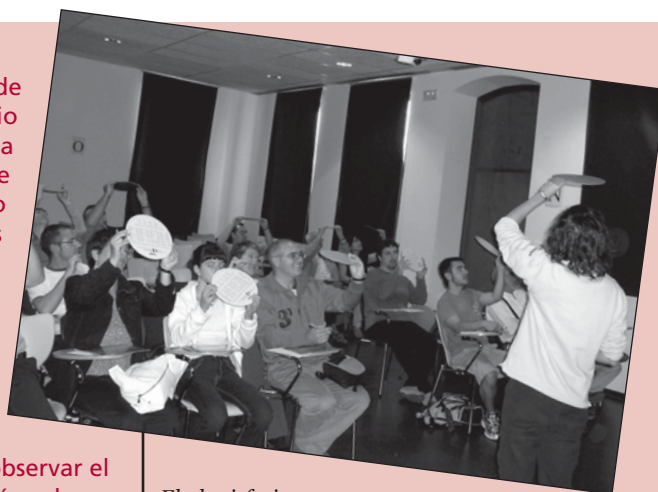
El planisferio es una de las herramientas utilizadas en este taller para aprender a identificar las distintas constelaciones del hemisferio Norte.

Para los aficionados a observar los cuerpos celestes, la Casa de las Ciencias también acoge estas semanas la exposición ' Marte-Tierra. Una anatomía comparada ', en la que pueden contemplarse, entre otras curio-