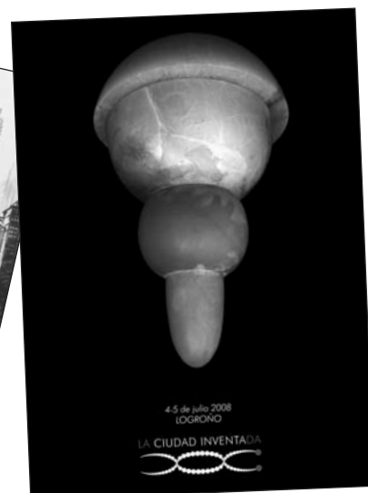
Cartel de Teo Sabando