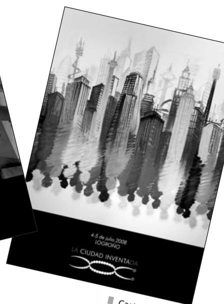
Cartel de Suso33