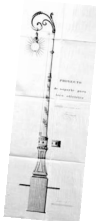
■ Modelo de farola eléctrica para Logroño. 1907. Archivo Municipal. (Fotografía: Óscar de la Mota)

Cada avance tecnológico ha tenido su plasmación en el alumbrado de nuestra ciudad. Y así, primero llegó el Gas (1877), suministrado por cañería por la Fábrica de Gas de Logroño y la Compañía