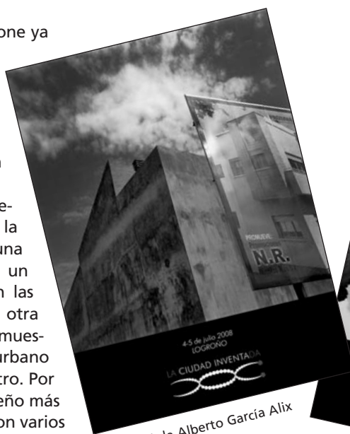
Cartel de Alberto García Alix

'La Ciudad Inventada' dispone ya de los carteles promocionales realizados por el fotógrafo Alberto García Alix, el escultor Teo Sabando y el graffitero Suso33, que se colocarán tras las fiestas de San Bernabé por todo Logroño. Los carteles plasman la interpretación que cada artista hace de la ciudad. García Alix opta por una imagen en blanco y negro de un edificio, en la que predominan las líneas rectas. Sabando escoge otra imagen en blanco y negro, que muestra una pieza de mobiliario urbano como es una lámpara de alabastro. Por su parte, Suso33 prefiere un diseño más colorista: el perfil de la ciudad con varios rascacielos que al girar la imagen se transforman en personas.