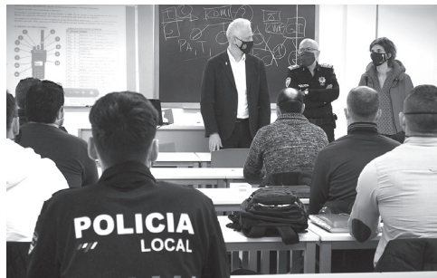
Saludo del alcalde de Logroño a agentes en formación.

El Cuerpo de Policía Local de Logroño contará con 31 nuevos efectivos, que desde el pasado 20 de enero iniciaron su proceso de formación y prácticas en la Academia de Policía Local de Logroño. Tras este periodo, se incorporarán a las fuerzas de seguridad municipales como policías de barrio, cuyo servicio está orientado a lograr un progresivo acercamiento a la ciudadanía, para conocer directamente sus problemas en materia de seguridad.