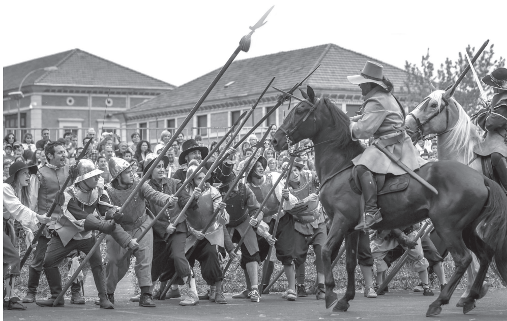
■ Recreación histórica del Sitio de Logroño.

A este punto de encuentro académico-cultural se suman otras actividades divulgativas, como un programa didáctico para desarrollar en colegios; un plan de visitas teatralizadas; charlas y ponencias; publicaciones elaboradas junto con diferentes instituciones académicas; o la apertura de espacios públicos y privados del siglo XVI, como el yacimiento del Convento de Valbuena, calados, lagares y otros lugares emblemáticos vinculados a la Ruta de Carlos I. "En este marco, cabe destacar la renovación de los paneles y contenidos multimedia del Cubo del Re-