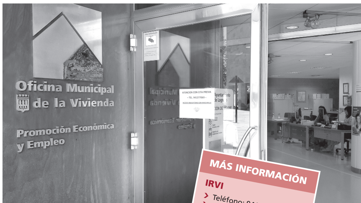
■ Entrada de la Oficina Municipal de Vivienda de Logroño

Por su parte, la Oficina Municipal de Vivienda de Logroño presta un servicio integral de información y asesoramiento en materia de vivienda, aborda de forma global y personalizada todas las partes