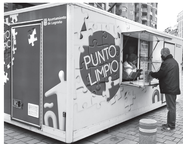
La red de puntos limpios es el servicio mejor valorado por la ciudadanía.

La red municipal de puntos limpios vuelve a ser el servicio mejor valorado en la encuesta, con una nota media de 9,32. También es destacable que el número de usuarios de estos puntos limpios ha vuelto a crecer. Otros aspectos que han registrado un aumento en la calificación son la recogida de residuos de los contenedores y los vehículos y medios utilizados para la limpieza y recogida. Destaca también la alta puntuación obtenida en la pregunta sobre la imagen del servicio, el personal, la maquinaria., que ha sido evaluada con 8,99.