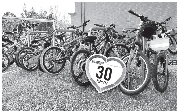
■ Aparcamiento para bicicletas en el CEIP Caballero de La Rosa.

Logroño es la primera ciudad de La Rioja en unirse al proyecto que ha elaborado unos criterios para determinar si el centro educativo alcanza un nivel de acreditación Oro, Plata y Bronce. De acuerdo a los objetivos que cumplan, ascenderán en una escala de valoración basada en las acciones que hacen para promocionar la bicicleta y otras formas activas de ir y volver de la escuela a casa. Por su parte, la DGT se encargará de coordinar el programa, asesorar y facilitar recursos didácticos, tecnológicos y personales. También auditará y revisará las actividades y esfuerzos de los colegios a la hora de motivar a toda la comunidad educativa para el uso la bicicleta en los desplazamientos al colegio. Por su parte, el Ayuntamiento realizará una labor de sen-