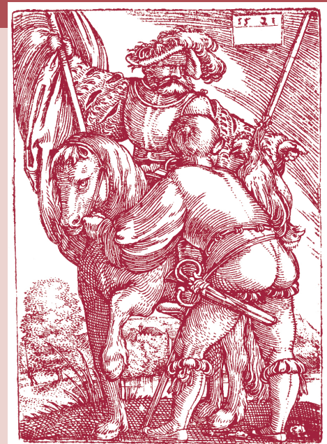
■ Soldado con portaestandarte. Biblioteca Digital Hispánica.