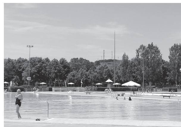
Complejo deportivo municipal de Las Norias.

De esta manera, podremos disfrutar de un verano estupendo -la temporada de piscinas se