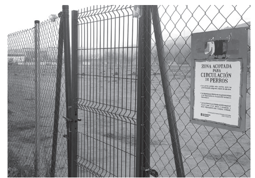
■ Zona acotada para circulación de perros en el Paseo del Prior.

La actual Ordenanza reguladora de la tenencia y protección de animales de compañía de la ciudad de Logroño establece que los perros solamente podrán estar sueltos en las zonas acotadas por el Ayuntamiento, debidamente señalizadas, en horario de primavera-verano: desde las 22:00 horas a las 7:30 horas del