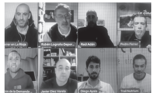
■ Participantes en la mesa redonda virtual 'Organización de Carreras'.