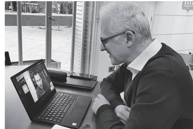
■ Pablo Hermoso de Mendoza, en la reunión virtual con el alcalde de Valladolid, Óscar Puente.

Los alcaldes de Logroño y Valladolid se han emplazado a una visita presencial cuando la situación sanitaria mejore para abordar, además, otros temas relacionados con la cultura y la promoción turística. De hecho, ambos ayuntamientos mantienen un convenio de intercambio publicitario entre ambas ciudades desde julio de 2020.