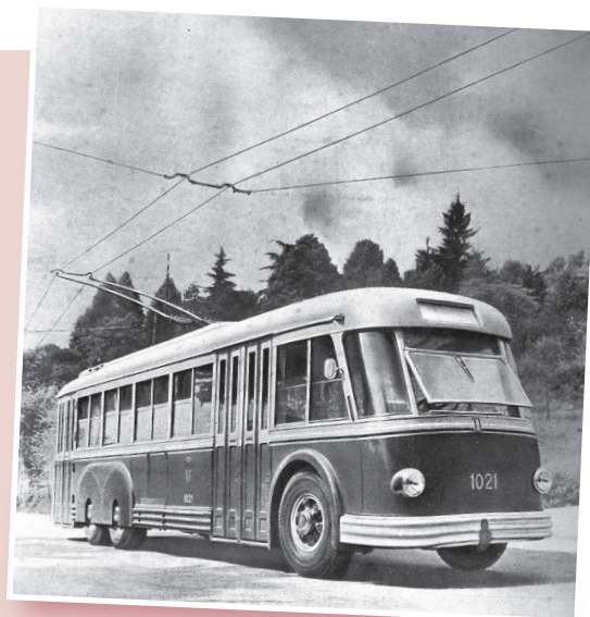
■ Imagen de un filobús.

Comienzan sin embargo a surgir imprevistos que a la poste impedirían su implantación: la Comisaría de Material Ferroviario informa que “debido a la penuria de materiales siderúrgicos y a la carencia de cobre para las líneas de contacto y de caucho para los bandajes, todas estas instalaciones son informadas desfavora-