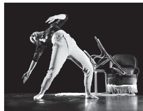
■ Espectáculo de danza incluido en el programa 'Tan Cerca' de 2022.

Los agentes culturales interesados pueden encontrar las bases de la convocatoria y la solicitud para presentarse en la web: santandercreativa.com . El plazo para optar a estas ayudas permanecerá abierto hasta las 23:59 horas del 10 de marzo y toda la documentación tendrá que ser remitida a: info@santandercreativa.com .