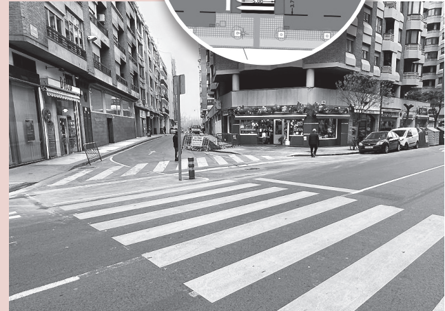
■ Intersección de las calles Gonzalo de Berceo y Trinidad.