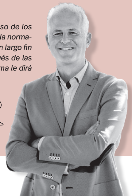
Pablo Hermoso de Mendoza / Alcalde de Logroño

suman a esta festividad que crece con el paso de los años. Una muestra más del deseo de volver a la normalidad y cumplir nuestros ritos y tradiciones. Un largo fin de semana para disfrutar. Y ya saben, después de las fiestas y de enterrar la sardina, Doña Cuaresma le dirá a Don Carnaval: ahora me toca a mí.