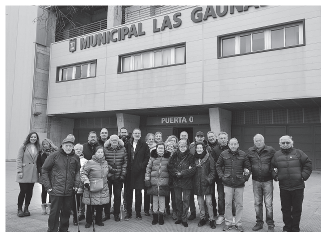
■ El concejal de Deportes con miembros de AFA.

El concejal de Deportes valora mucho esta iniciativa de los veteranos del Logroñés que