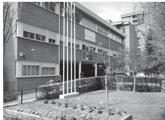
■ CEIP Doctor Castroviejo, donde el Ayuntamiento lleva a cabo obras de reparación.

Durante las pasadas navidades, el Ayuntamiento realizó trabajos de pintura en la segunda planta del CEIP Vuelo Madrid-Manila y está previsto pintar en verano la primera y la planta baja. El pasado verano también se llevaron a cabo obras de renovación de aseos en el CEIP Varia y en el CEIP San Pío X. Próximamente, se iniciarán las obras de remodelación del patio del CEIP Navarrete el Mudo.