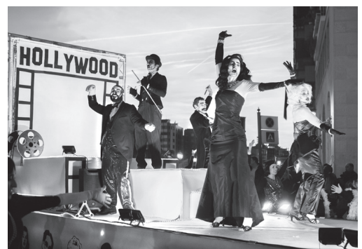
Imágenes de pasadas ediciones del desfile de Carnaval.

Concierto de órgano. 20:45 horas. La Redonda.