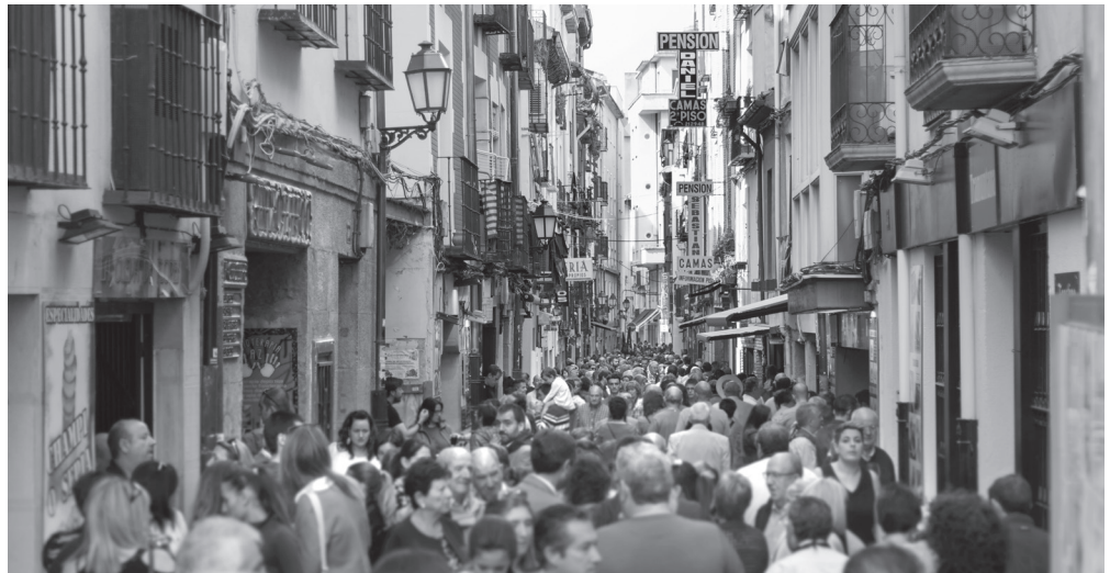
■ Calle San Juan de Logroño, uno de los focos de atracción de visitantes a la ciudad.

Respecto a los peregrinos que realizaron el Camino de Santiago en 2022, Logroño acogió a 10 458 en el albergue municipal, una cifra