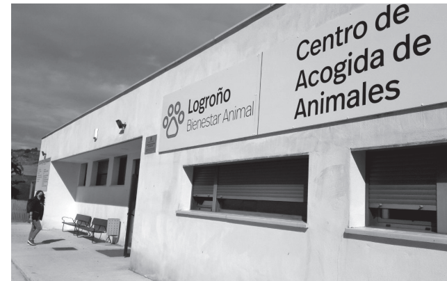
■ Centro Municipal de Acogida de Animales.

El Centro de Acogida de Animales registró en 2021 un total de 192 adopciones de perros y