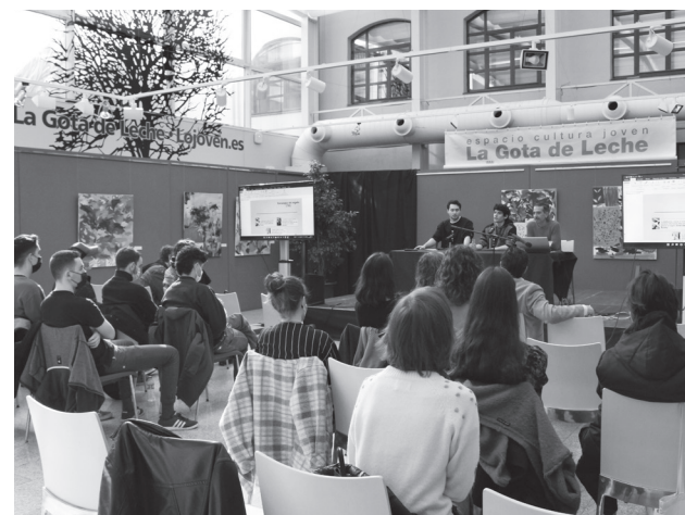
Acto de presentación de las Becas Inicia, en el patio de La Gota.

i Más información e inscripciones: lojoven.es .