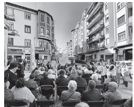
■ La actividad se celebró en la plaza Pilar Salarrullana.

El Ayuntamiento de Logroño, el Gobierno de La Rioja y la Fundación 'la Caixa' han organizado por primera vez en Logroño la actividad que se llama 'Maratón de Palabras', 'Una palabra para cambiarlo todo'.