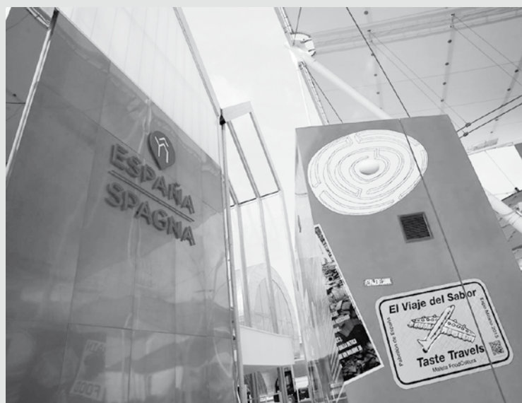
Imagen del Pabellón de España en la Exposición Universal de Milán.

La Expo de Milán 2015 reúne del 1 de mayo al 31 de octubre a más de 150 países y organismos internacionales bajo el lema 'Alimentar el planeta. Energía para la vida' y prevé atraer a más de 20 millones de visitantes. Pretende, además, ser la primera exposición universal recordada no sólo por su arquitectura y actividades, sino también por su contribución al debate y la educación sobre la nutrición, la comida y los recursos a nivel mundial.