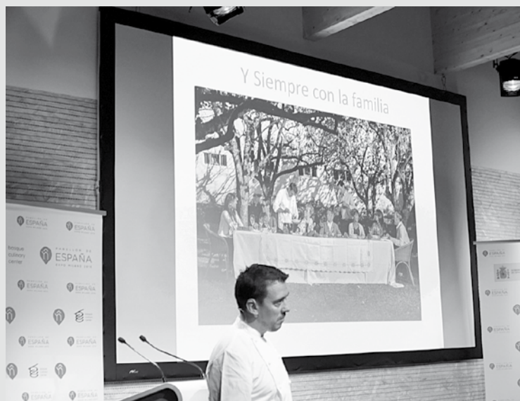
El cocinero riojano Francis Paniego protagonizó una de las ponencias sobre gastronomía.