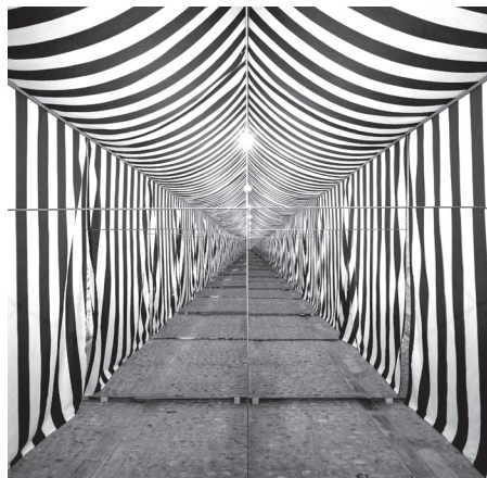
■ Sticks & Stones , de Anna & Eugeni Bach. Calado de San Gregorio.