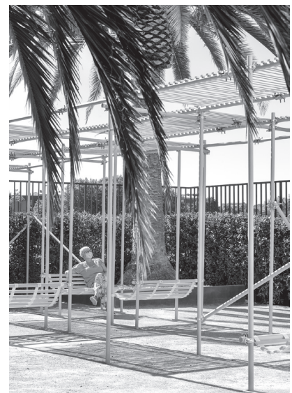
■ A través de los límites , de Taneli Mansikkamäki (AGO). Patio del COAR.