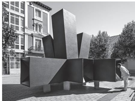
■ Prismarium , de Ignacio Hornillos Cárdenas y Javier Fernández Contreras. Plaza de las Escuelas Trevijano.