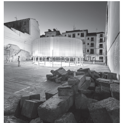
■ Circo aéreo , de KOGAA. Aparcamientos en la Calle Mayor.