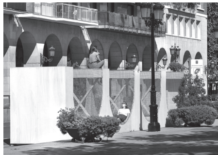
■ Arch-play , de Silvia Bachetti - Agnese Casadio. Paseo del Espolón.