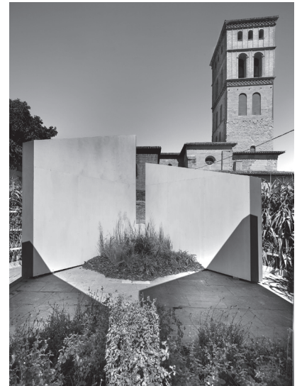
■ Patio de reflexiones , de Storey Studio. Plaza de San Bartolomé.