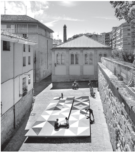
■ Fiesta , de Attila KIM & Bogdan CIOCODEICA. Plaza del Revellín.

da reflexión sobre el ámbito urbano y la ciudad. El Festival ha invitado a recorrer la ciudad mediante instalaciones, exposiciones, encuentros, actividades e intervenciones artísticas que han logrado conectar a la ciudadanía con las sedes, plazas, calles, patios y con espacios ocultos que habitualmente pasan desapercibidos en el día a día.