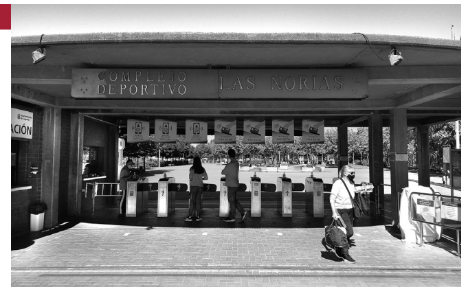
■ Acceso a las instalaciones de Las Norias.

Respecto al nuevo espacio de Pradoviejo, Antoñanzas ha señalado que "se propuso como alternativa a las piscinas cuando se estableció un aforo del 30% y ha funcionado muy bien. Invertimos muy poco en su acondicionamiento y ha sido disfrutado por muchas