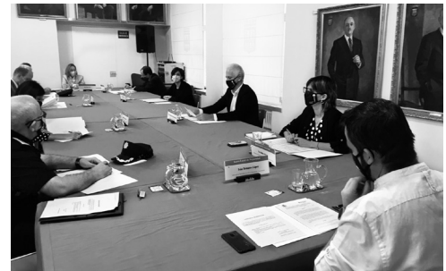
Reunión de la Junta Local de Seguridad.

En este sentido, se han introducido novedades en el protocolo de seguimiento, como la creación de una mesa de coordinación entre ambos cuerpos con periodicidad trimestral, o la posibilidad de entrevistas en prisión con el agresor antes de su salida en libertad por parte de Policía Local. Todas estas actuaciones, ajustadas a la normativa actual, tienen como finalidad principal que ambos cuerpos policiales continúen colaborando de forma