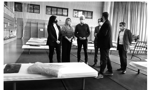
Visita al dispositivo, situado en el polideportivo de la Universidad de La Rioja.

Con este dispositivo, al que está previsto que se sumen otros en diversas localidades de La Rioja, el Ayuntamiento de Logroño, en colaboración con el resto de instituciones, "pretendemos facilitar el desarrollo de los trabajos de la vendimia en las mejores condiciones sanitarias para los trabajadores del campo, sus emplea-