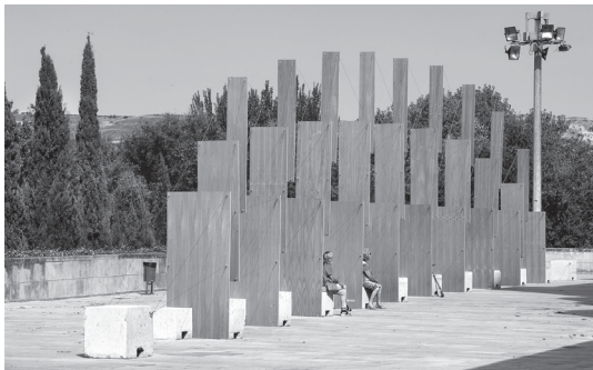
■ Arcos , de Jordi Galí. Entorno Iglesia de Santiago.