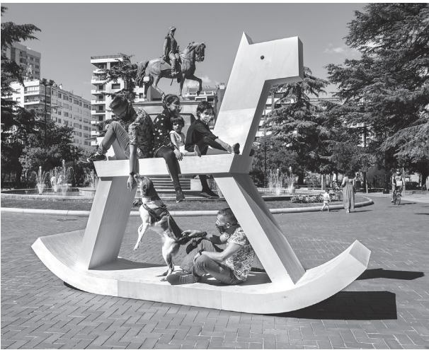
■ Estatua ecuestre , de Iza Rutkowska. Paseo del Espolón.