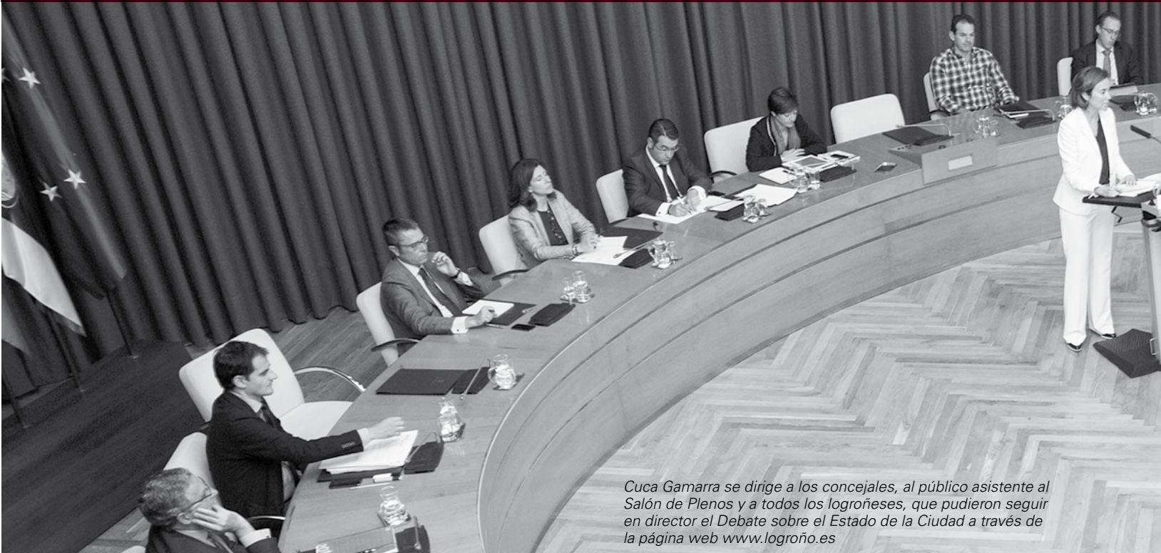
Cuca Gamarra se dirige a los concejales, al público asistente al Salón de Plenos y a todos los logroñeses, que pudieron seguir en directo el Debate sobre el Estado de la Ciudad a través de la página web www.logroño.es

La alcaldesa de Logroño, Cuca Gamarra, repasó los hechos de la "legislatura más difícil de la historia democrática de la ciudad", para construir, entre todos, un futuro de progreso. Un largo listado de realidades, que demuestran que "estamos en un momento de crisis para los logroñeses. En el Debate sobre el estado de la Ciudad se