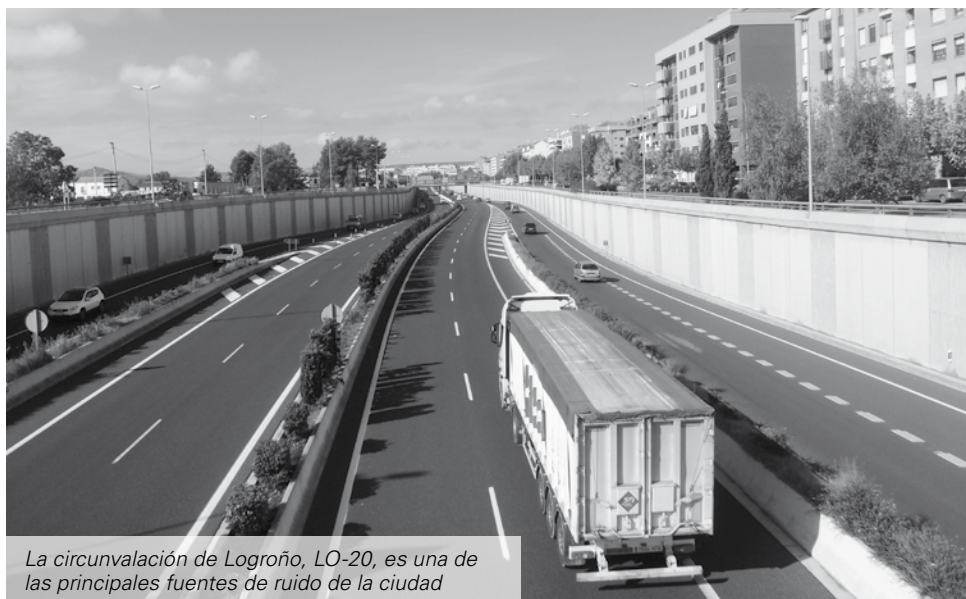
La circunvalación de Logroño, LO-20, es una de las principales fuentes de ruido de la ciudad

La contaminación acústica es uno de los principales factores que condicionan la calidad del medio ambiente urbano y, por