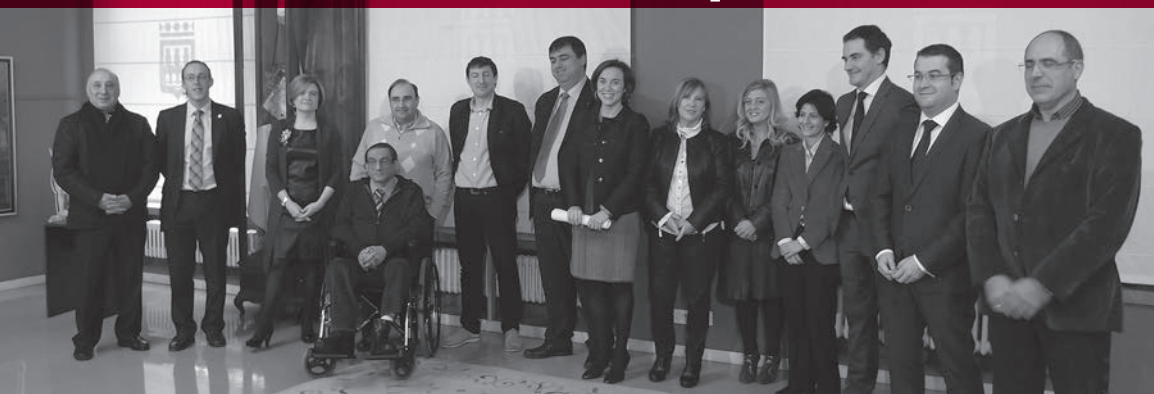
La alcaldesa y varios concejales, junto a representantes de colectivos de personas con discapacidad

El Ayuntamiento de Logroño ha sido merecedor del Premio Reina Sofía 2013 de Accesibilidad Universal de Municipios, un reconocimiento convocado por el Real Patronato sobre Discapacidad, en colaboración con la Agencia Española de Cooperación Internacional al Desarrollo y la Fundación ACS.