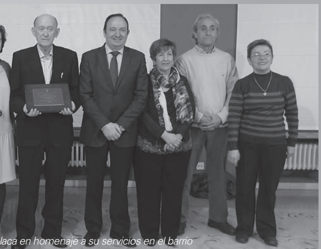
Actuación en homenaje a su servicios en el barrio

una colaboración con la Diócesis que hasta el momento se circunscribía al Casco Antiguo.