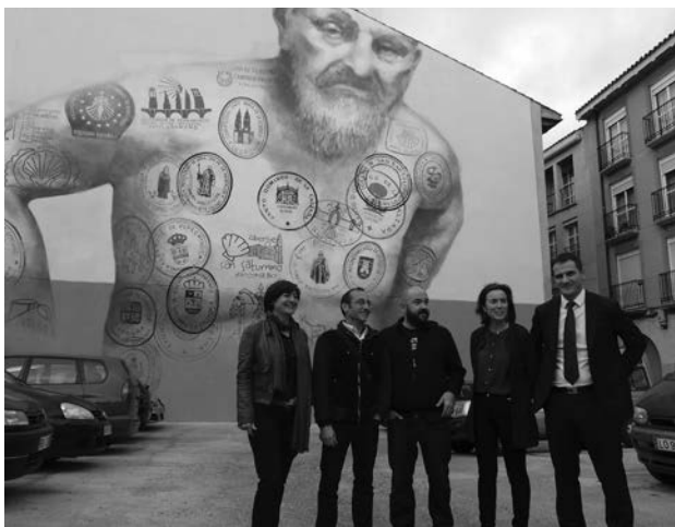
La primera obra de la 'Ruta Mural Jacobea' se encuentra en la calle Barriocepo, en las traseras de la Casa de la Inquisición