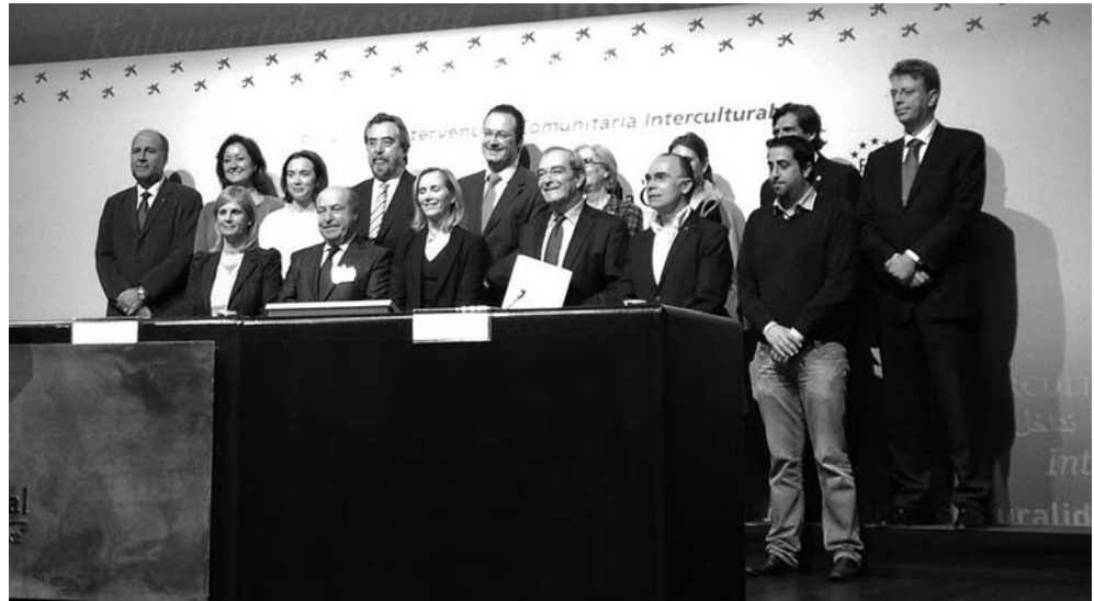
La alcaldesa de Logroño, junto a representantes de los catorce municipios de España que firmaron el compromiso

Este proyecto, que en Logroño el Ayuntamiento acomete de la mano de Rioja