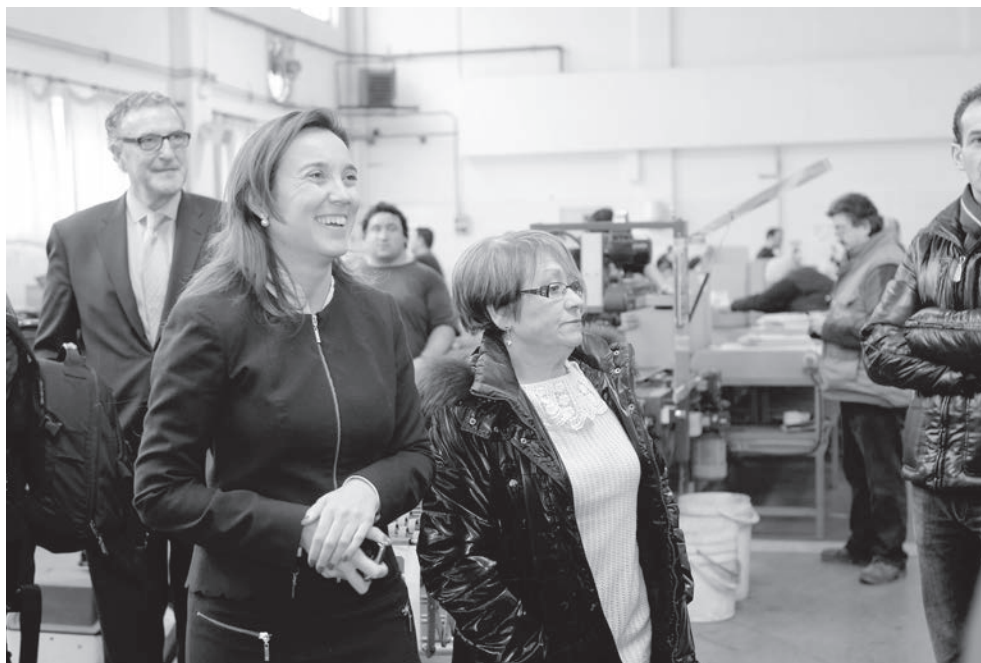
La alcaldesa de Logroño visitó la pasada semana el Centro Especial de Empleo que la Fundación Asprem (Asproma-Empleo) tiene en Logroño y conoció las actividades laborales que desarrollan sus usuarios.

Y para que la ayuda institucional que se presta tenga mayor eficacia, la vía que se utiliza es a través de las organizaciones sin ánimo de lucro, que llevan ya años entroncadas en estos colectivos, colaborando con ellos tanto en el ámbito social como laboral.