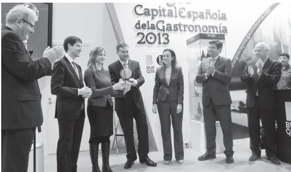
Momento en que Logroño cede a Burgos la Capitalidad Española de la Gastronomía