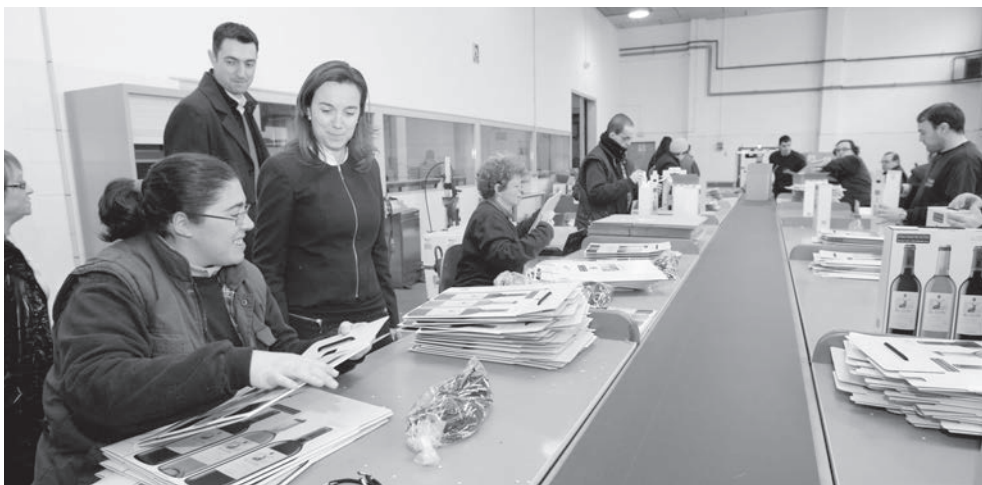
En las instalaciones de la Fundación Asprem los usuarios trabajan en distintas líneas de producción: unos procesan botellas de vino de una bodega de Logroño, otros embotan encurtidos para una empresa logroñesa, etc.

Para este ejercicio, la partida consignada es de 160.000 euros, que podrá también suplementarse en función de las necesi-