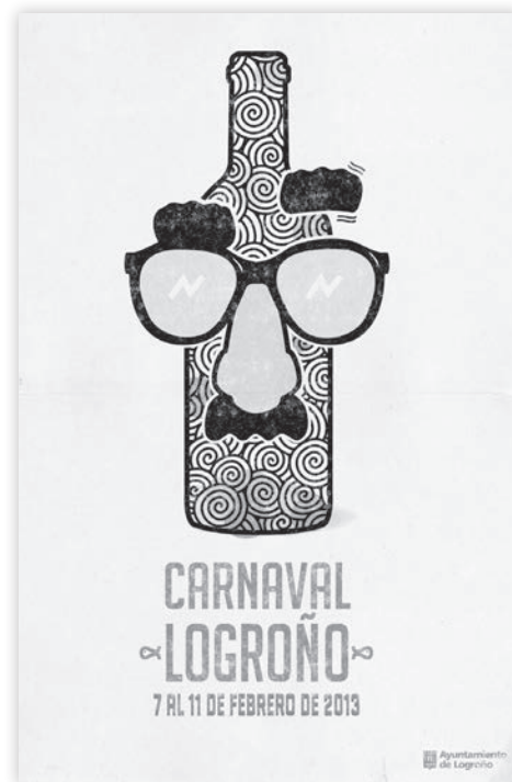
Miriam Clerigues y Víctor Arribas, alumnos del último curso de la especialidad de Diseño Gráfico de la Escuela Superior de Diseño de La Rioja, son los autores del diseño del material de Carnaval.

El programa está disponible en la web municipal www.logroño.es/carnaval , por primera vez, en la app logroño.es para dispositivos móviles.