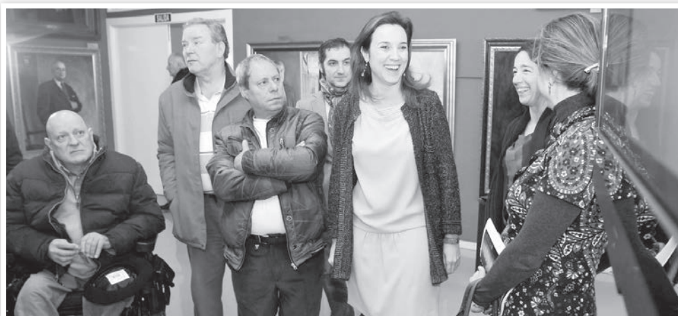
La alcaldesa de Logroño conversa con representantes de la comisión vecinal que ha canalizado las aportaciones de vecinos, comerciantes y usuarios de la zona próxima a la plaza Primero de Mayo

La alcaldesa de Logroño destaca la importancia del proceso participativo que ha determinado una reforma muy demandada y que incrementará la calidad de vida de la zona