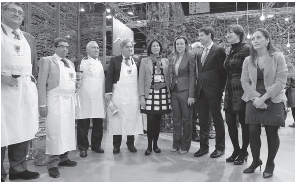
La alcaldesa de Logroño con la secretaria de Estado de Turismo y los miembros de la Cofradía del Pez, que se desplazaron a Madrid para recrear el reparto del pan, el pez y el vino. A la derecha, una de las catas de vino de Rioja celebradas en el marco de FITUR y una imagen del expositor de Logroño en la feria.

La alcaldesa se reunió con la secretaria de Estado de Turismo, quien aseguró que “los ritmos de trabajo van por el buen camino” y ofreció “toda la colaboración del Gobierno de España” para la declaración de San Bernabé como Fiesta de Interés Turístico Nacional