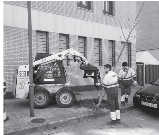
■ Plantación de árboles en alcorques de la ciudad.

Esta campaña se suma a las realizadas en años anteriores. Entre 2019 y 2022, el Ayuntamiento ha plantado 3 986 árboles y 12 061 arbustos en Logroño. Con estos datos, la masa forestal