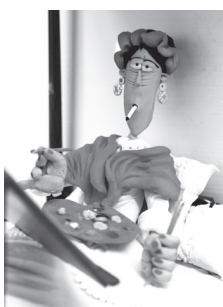
■ Frida Kahlo