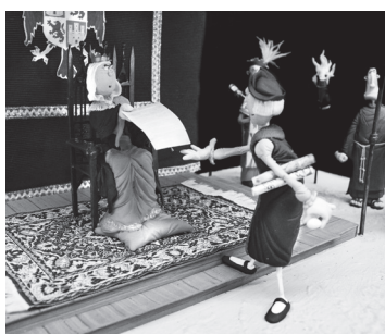
■ Isabel la Católica