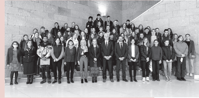
■ Jóvenes participantes en el intercambio escolar del pasado año.

Desde la Unidad de Educación del Ayuntamiento de Logroño se ha invitado a participar a todos los centros de Enseñanza Secundaria de Logroño y al instituto La Laboral. El programa cuenta con 200 plazas, 100 para cada destino, y la cuota de parti-