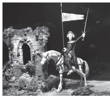
■ Juana de Arco