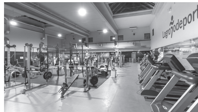
■ Sala de musculación de La Ribera.

La renovación de maquinaria se complementa con la reutilización de los elementos retirados, ya que estos –en perfectas condiciones de uso tras ser revisados por los técnicos municipales– están siendo donados a federaciones y entidades deportivas y sociales de la ciudad. La Cocina Económi-