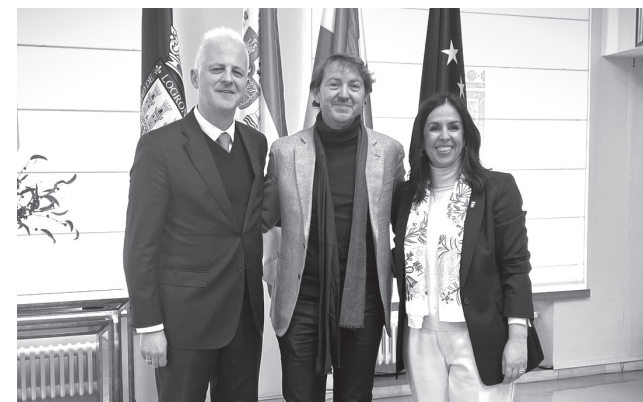
■ El alcalde, el director de la Fundación Vivanco y la concejala de Turismo, en la presentación de los proyectos.

“Estas exposiciones forman parte de la próxima apertura al público del Centro de la Cultura del Rioja, para la que estamos trabajando a través de diferentes licitaciones y contratos variados, para que sea, como siempre hemos dicho, un espacio de uso polivalente que englobe diferentes actuaciones de índole artística, cultural, formativa y empresarial que se convierta en eje vertebrador de nuestro proyecto Enópolis e integrador de la cultura del vino en nuestro municipio”, ha señalado el alcalde.