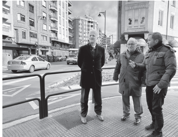
El alcalde, el director general de la DGT y el concejal de Desarrollo Urbano Sostenible visitaron algunas de las obras desarrolladas en Logroño para mejorar la seguridad y reducir la siniestralidad.

“El futuro de las ciudades se juega en el terreno de la movilidad, las que lo resuelvan bien atraerán talento e inversiones y las que no, quedarán atrapadas en el ruido, la congestión y la contaminación, por lo que hay que arriesgar”, destacó.