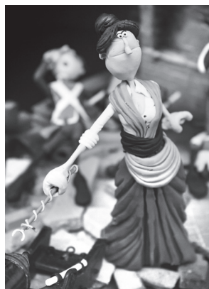
■ Agustina de Aragón