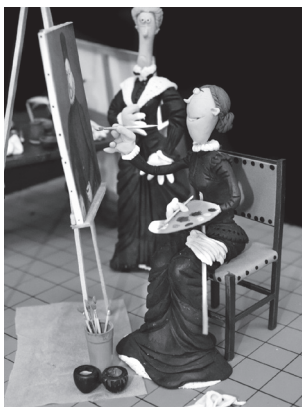
■ Sofonisba Anguissola

Una muestra que no solo pretende educar, sino también ofrecer a las generaciones presentes y futuras los logros obtenidos por referentes femeninos en todas las disciplinas, lo que puede servirles de inspiración, ya que se acerca a las personas visitantes a alguna de las muchas mujeres que han dejado su huella a lo largo de la historia y que han contribuido al desarrollo de la humanidad.