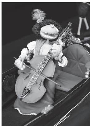
■ Bárbara Strozzi