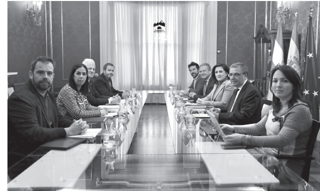
■ Última reunión del Consejo de Capitalidad.

Marqués de Vallejo o la red de carriles ciclopeatonales que conectan las áreas metropolitanas de Logroño, que se inicia en marzo.