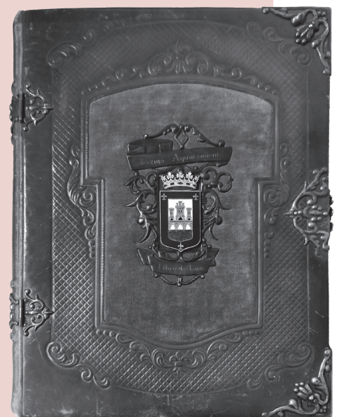
■ Libro de firmas.

o la propia Ana María Matute, han dejado su firma y, en ocasiones, su sentida dedicatoria a Logroño.